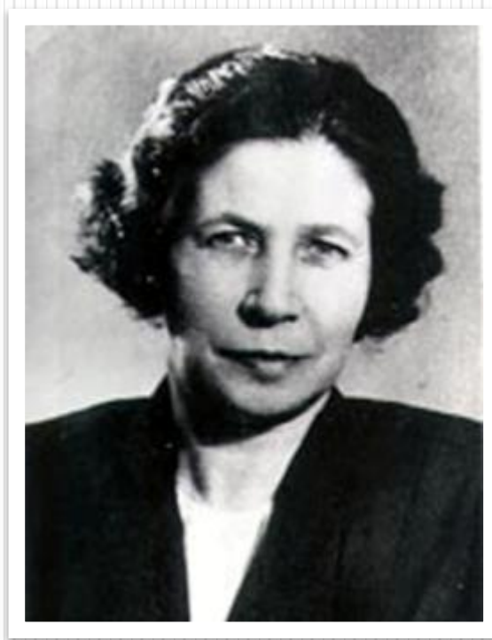
● Валентина Александровна Осеева