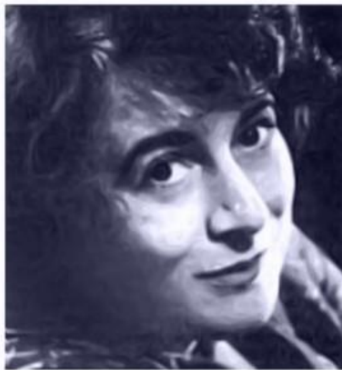
● Эмма Мошковская