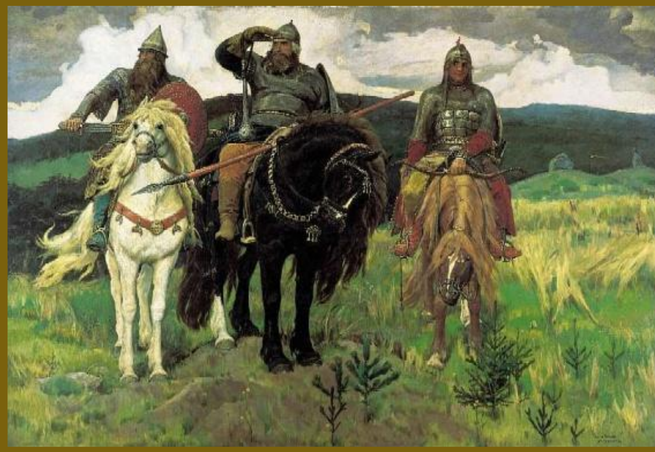
В. Васнецов. Богатыри 1881-1898, холст, масло, 295,3x446 см Государственная Третьяковская галерея, Москва