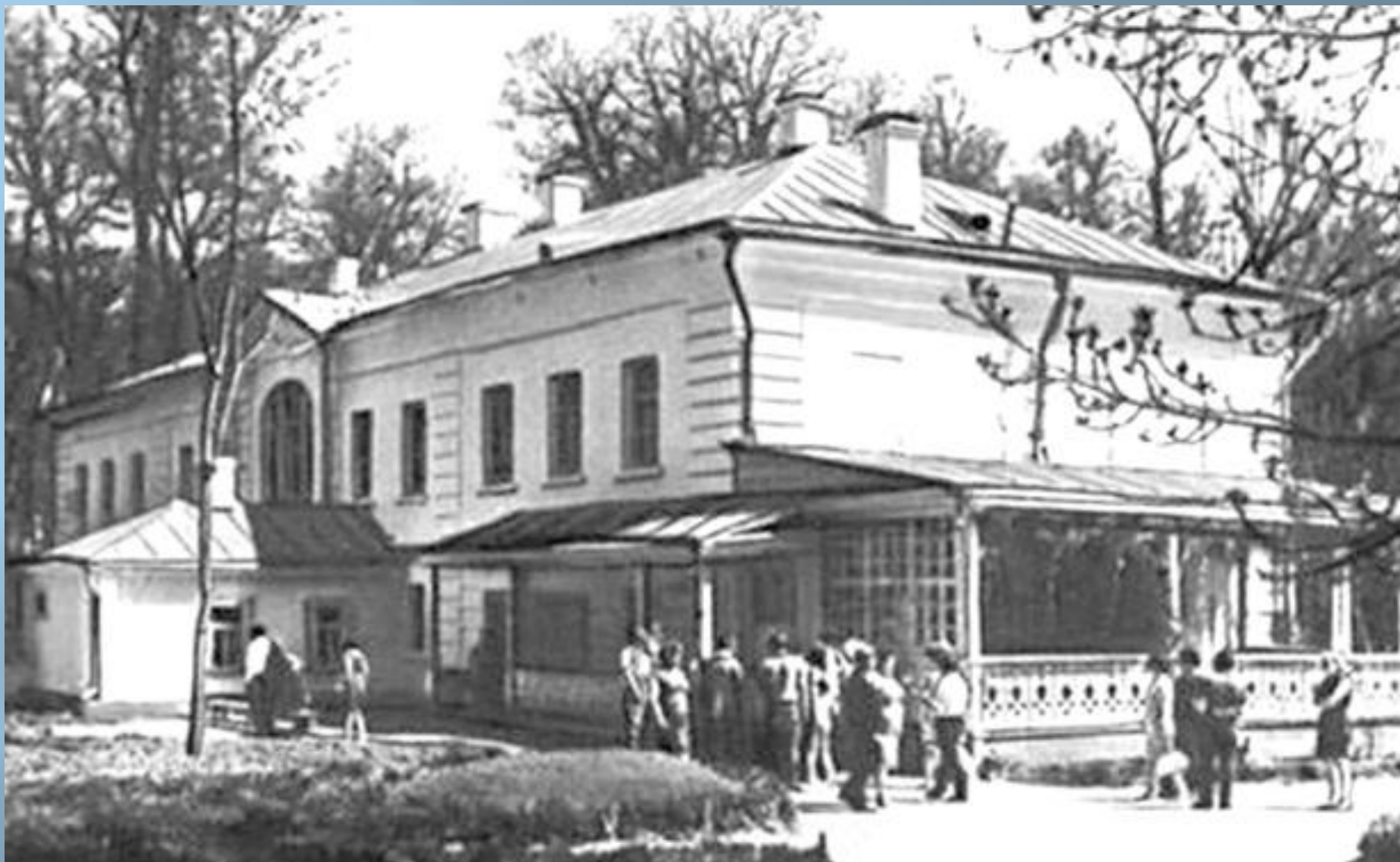
Усадьба писателя Льва Толстого в Ясной Поляне