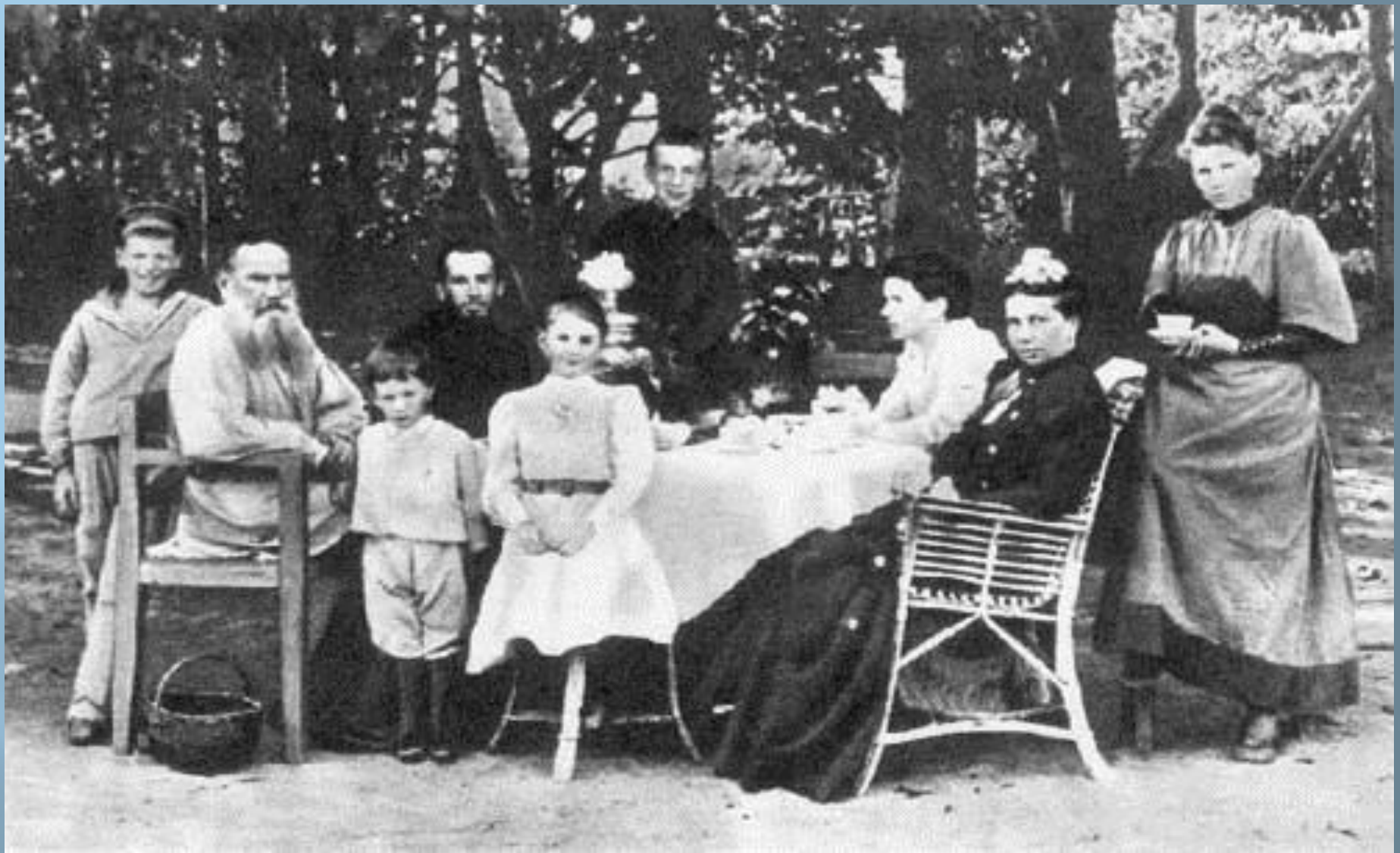
Лев Толстой в кругу семьи