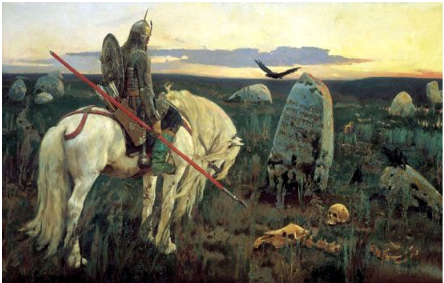
В. Васнецов. Витязь на распутье Холст, масло. 1882 г. Москва, Россия. Государственная Третьяковская галерея