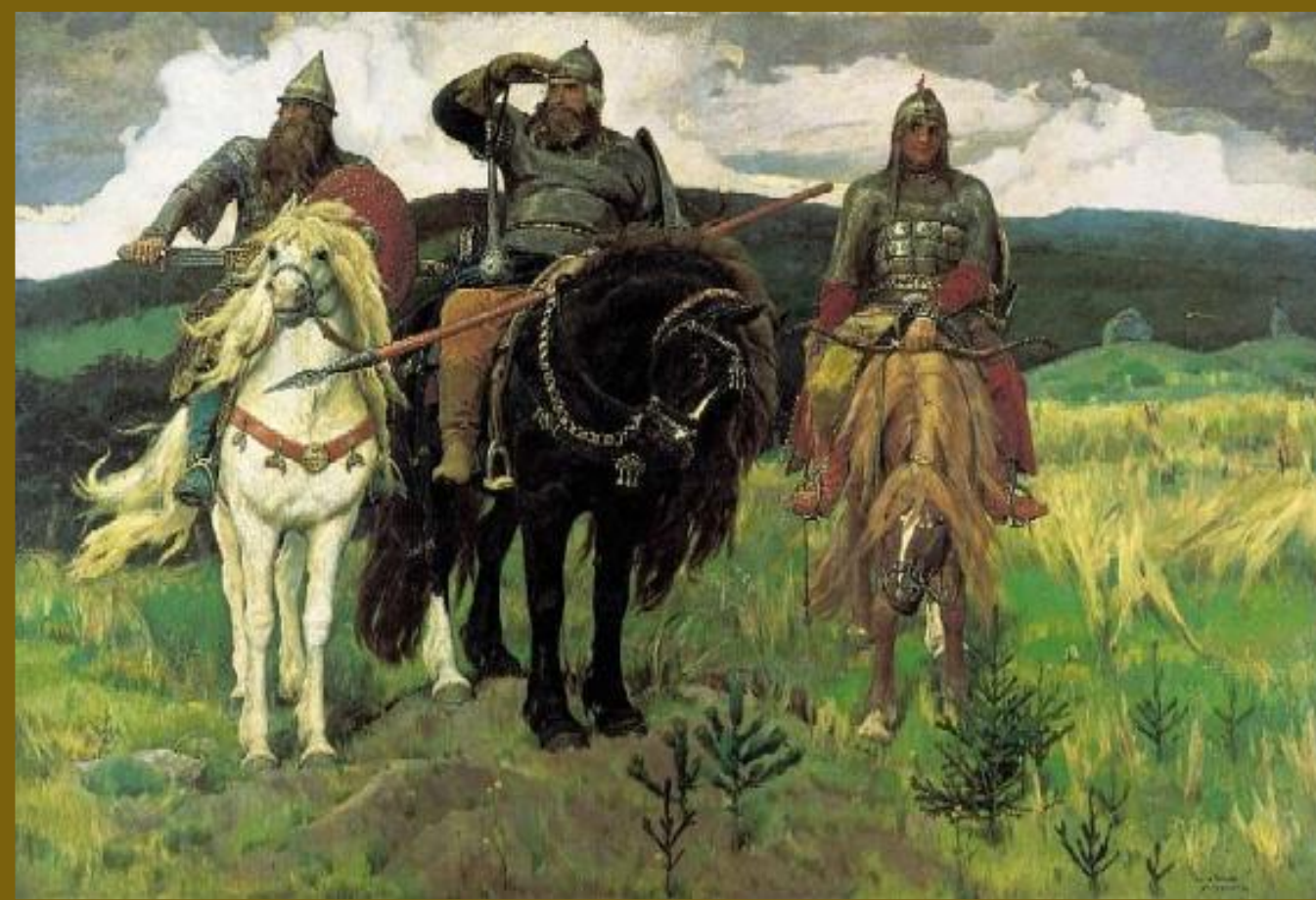
В. Васнецов. Богатыри 1881-1898, холст, масло, 295,3x446 см Государственная Третьяковская галерея, Москва