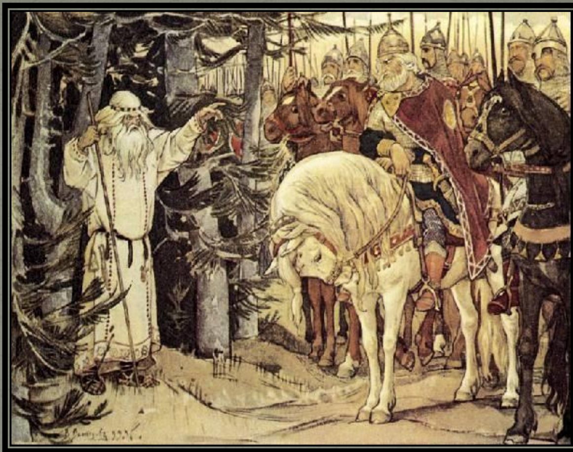
Иллюстрация к "Песни о вещем Олеге" А.С.Пушкина 1899г, акварель, Государственный Литературный музей, Москва