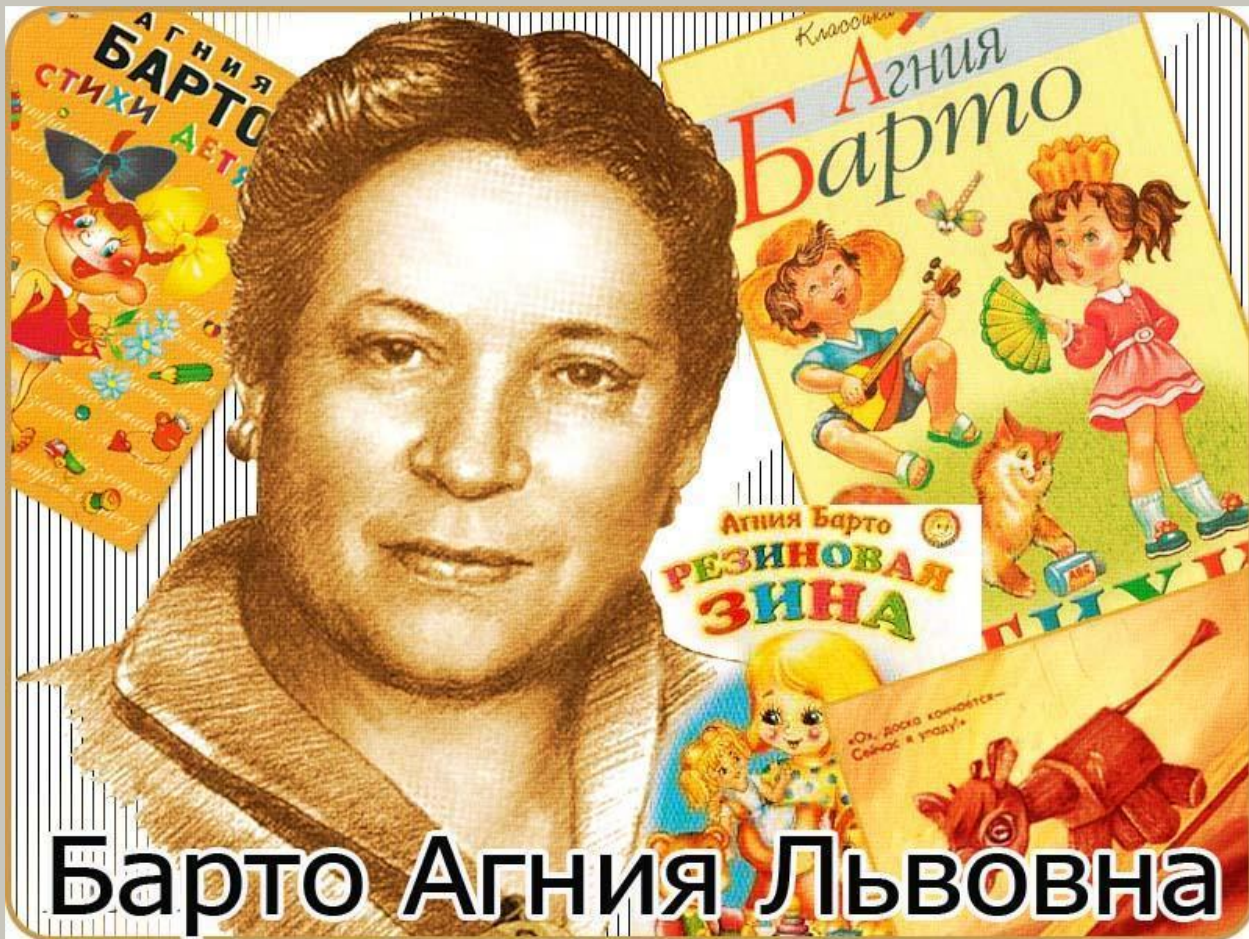
Барто Агния Львовна