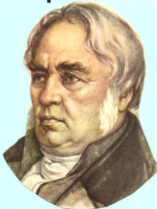
Ивана Андреевича Крылова