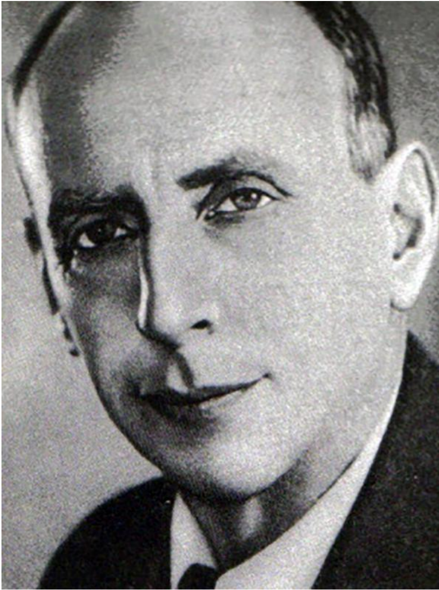
Евгени й Львови ч Шварц