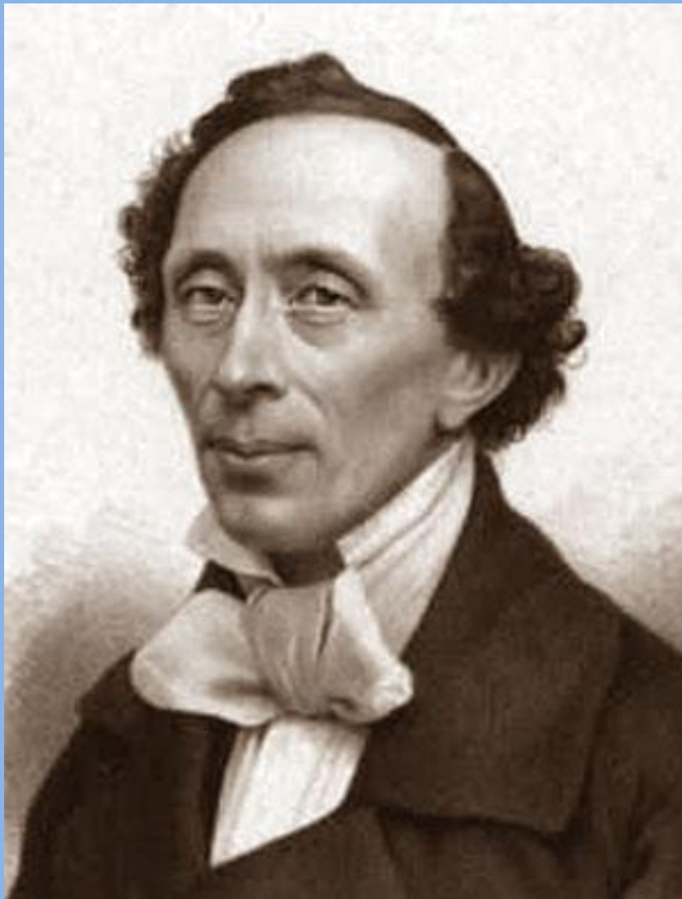
Ганс Христиан Андерсен