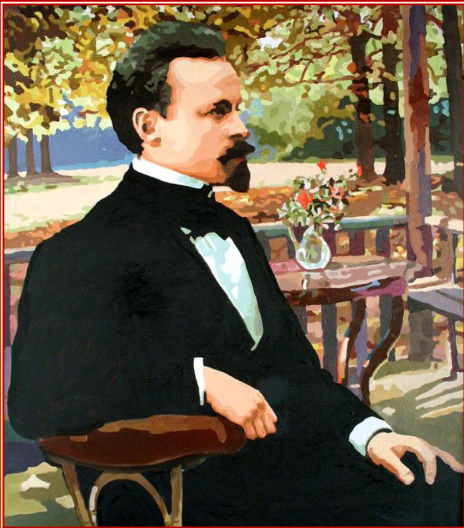
Константин Дмитриевич Бальмонт (1867 – 1942)