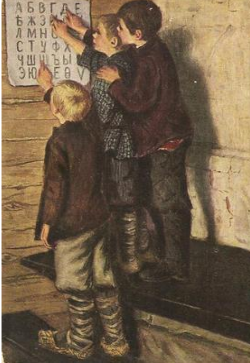
Новые ученики Н.П.Богданов-Бельский