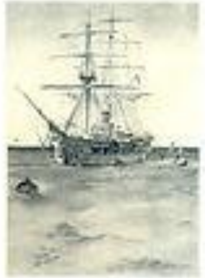
— 22 —