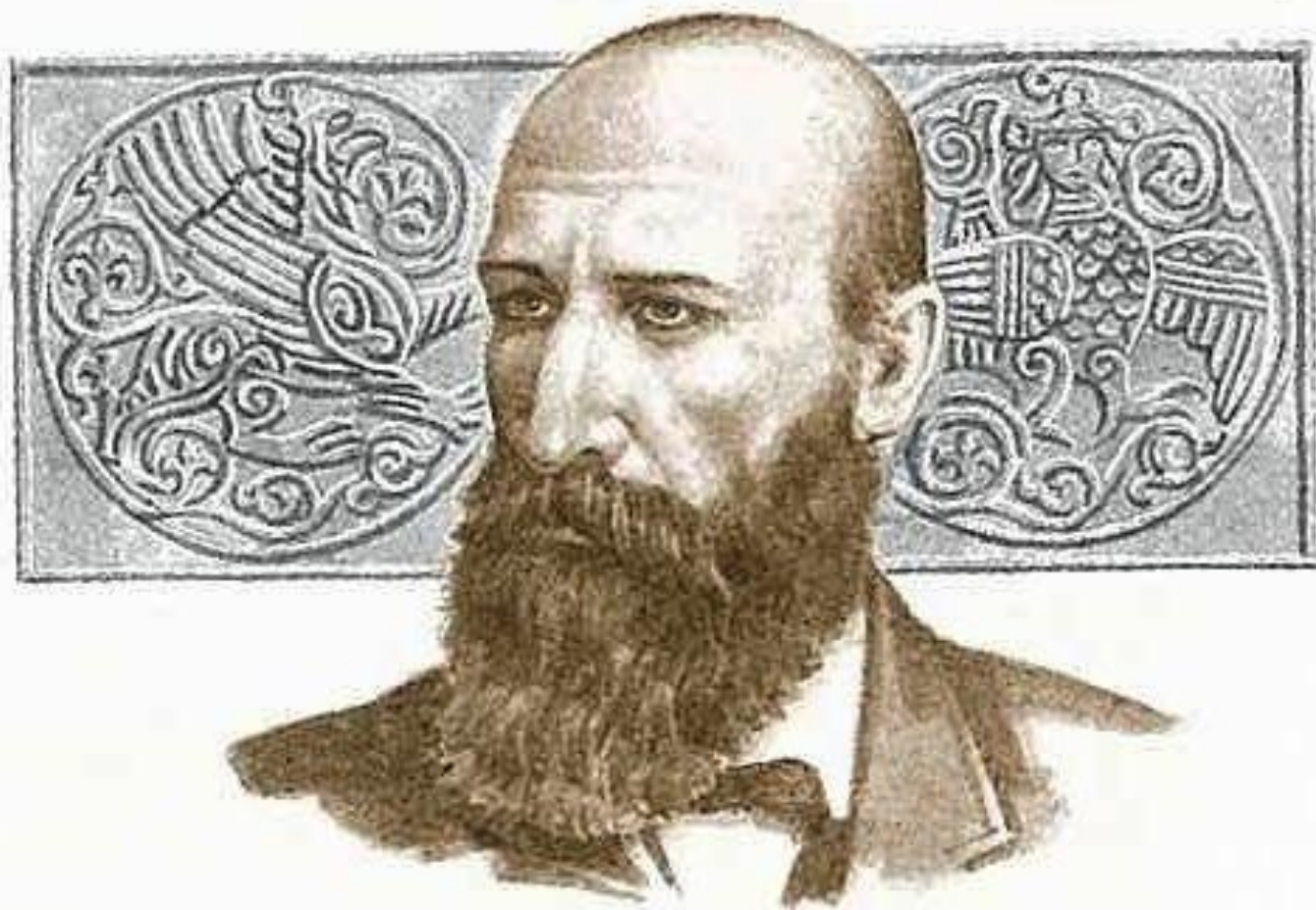
Историк, литературовед, этнограф и фольклорист А. Н. Афанасьев · 1826–1871