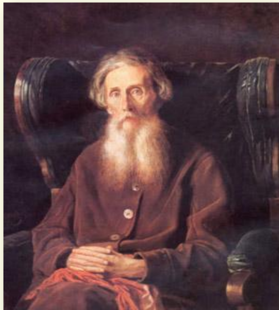
В. И. Даль (1801 — 1872 ) — создатель «Толкового словаря живого великорусского языка» Портрет худ. В. Г. Перова