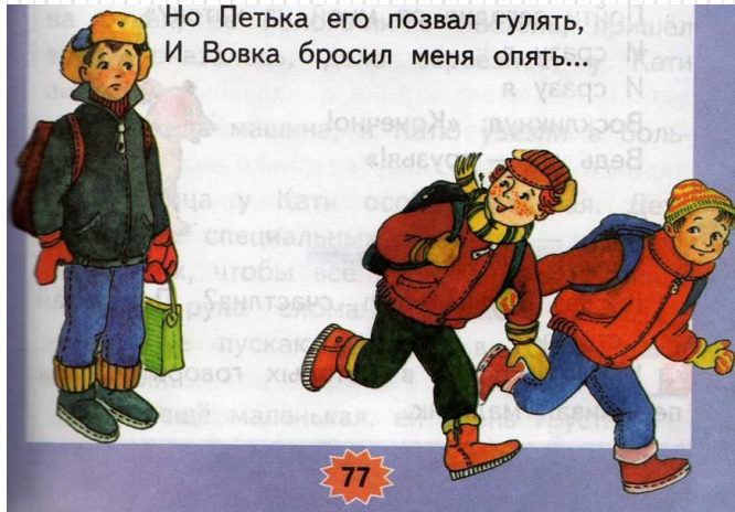
В.Лунин «Я и Вовка»