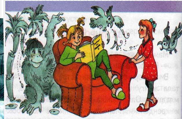
Ю.Ермолаев «Два пирожных»