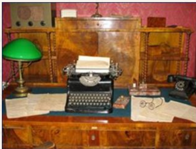
Миша Зощенко 1897г.