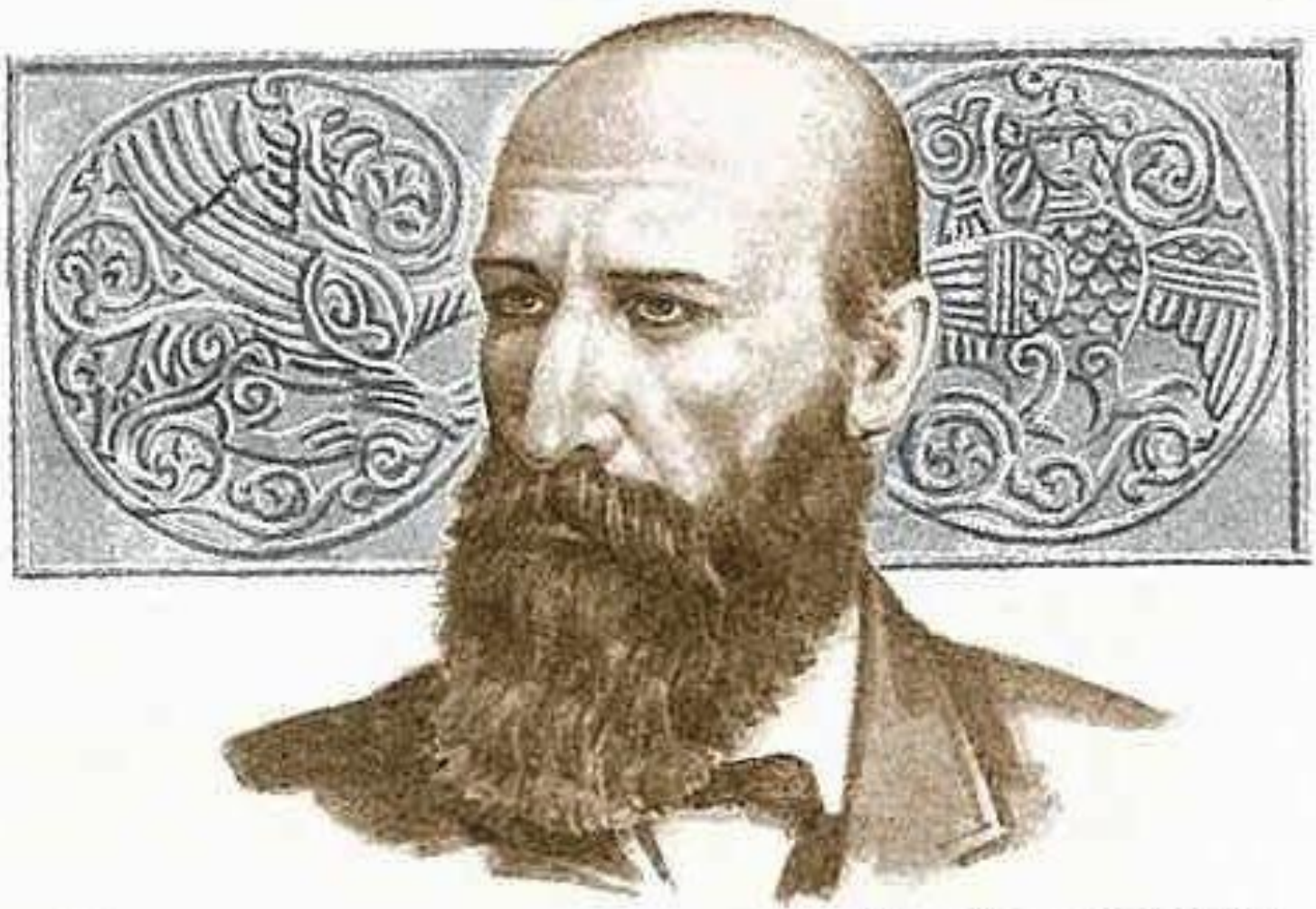
Историк, литературовед, этнограф и фольклорист А. Н. Афанасьев · 1826–1871