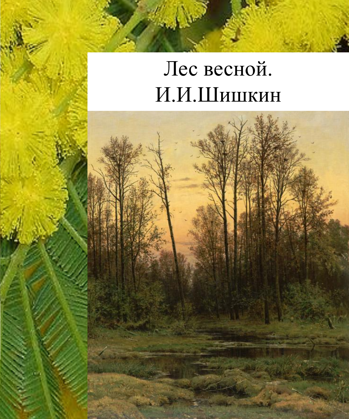
Лес весной. И.И.Шишкин