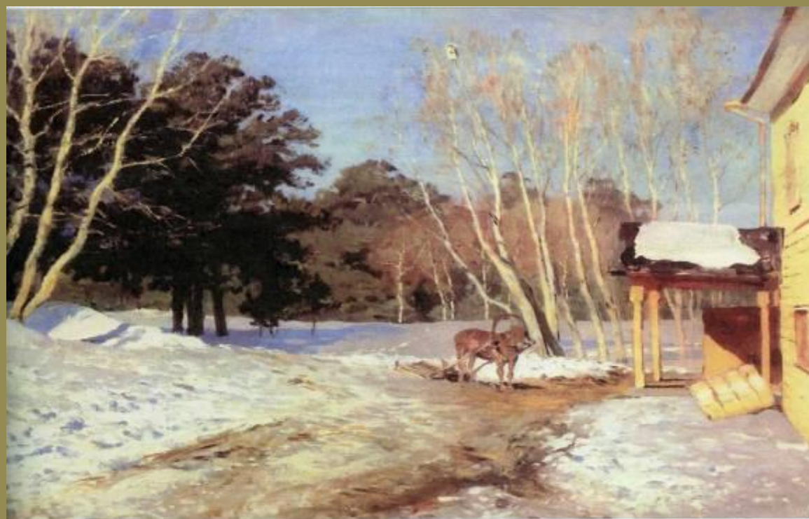
Исаак Ильич ЛЕВИТАН (1860—1900) Март. 1895 г.