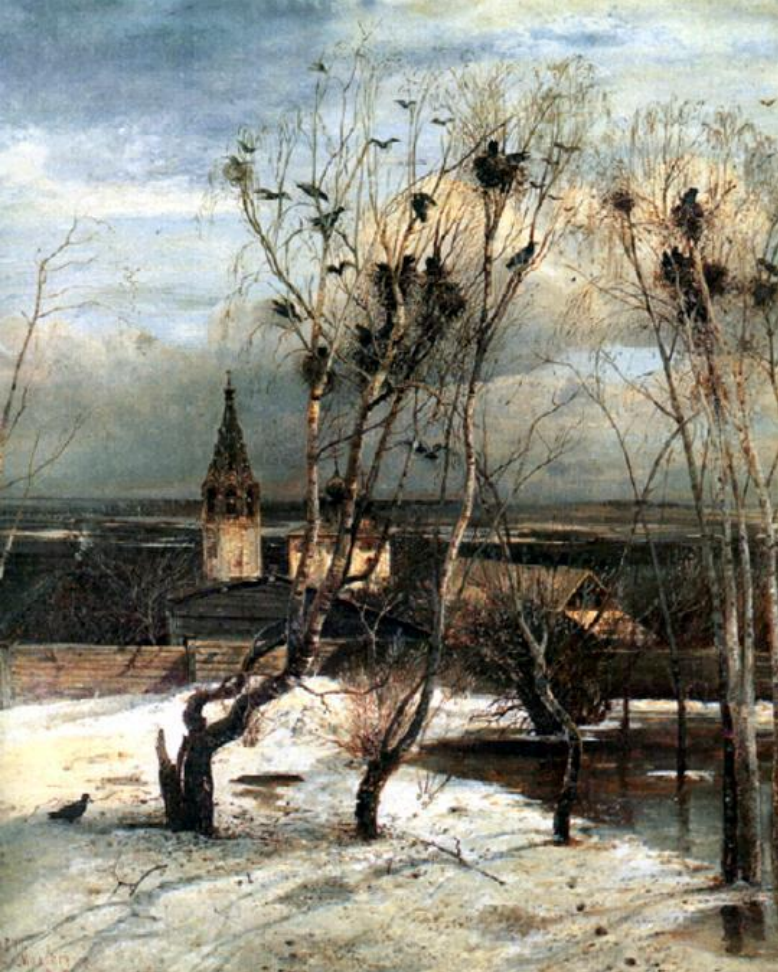
Грачи прилетели. А.К.Саврасов