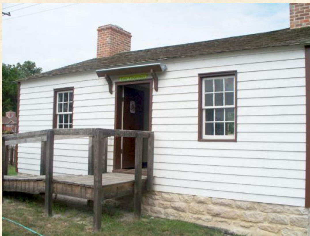
Дом Гекльберри Финна.