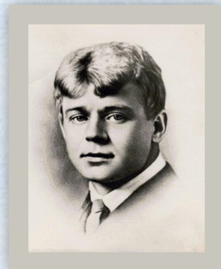
С. А. Есенин