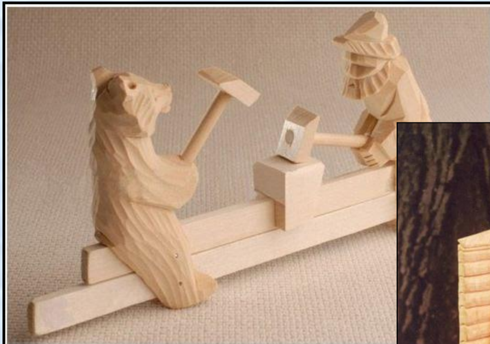
Богородская игрушка "Кузнецы".

Легенда о том, как зародился промысел Богородской игрушки, рассказывает, что первую деревянную игрушку сделал сам Преподобный Сергей. Будто бы он в свободное от молитв и трудов время вырезал из липы птичек, коньков и дарил "на благословенье" детям.