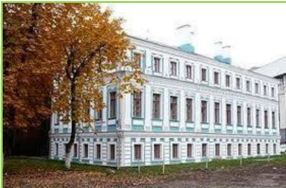
Дом-музей И. Никитина в Воронеже

Иван Саввич Никитин родился 21 сентября 1824 года в Воронеже. Отец его был торговцем - владел свечным заводом и лавкой.