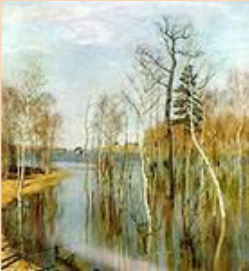
И. Левитан «Весна. Большая вода»