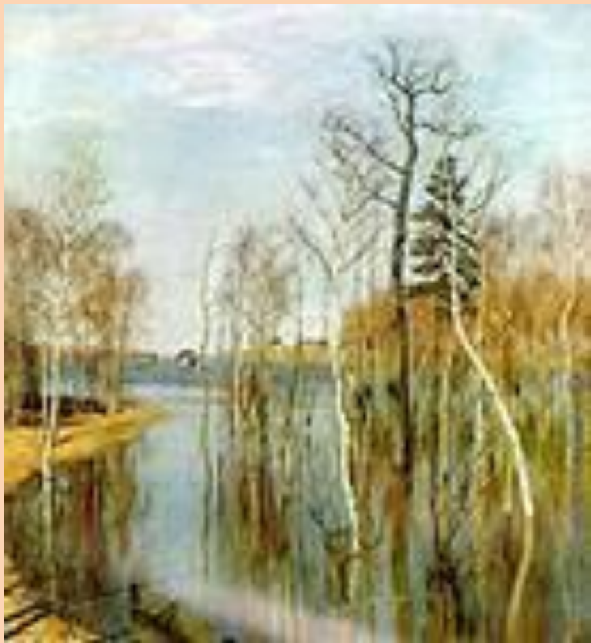
И. Левитан «Весна. Большая вода»