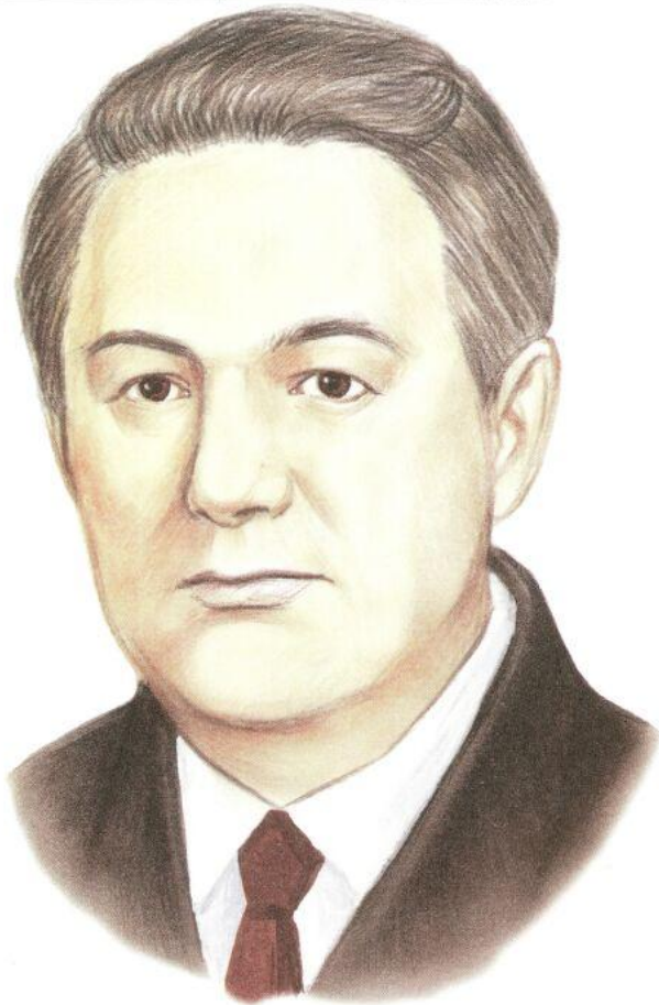
Сладков Николай Иванович (1920-1996)