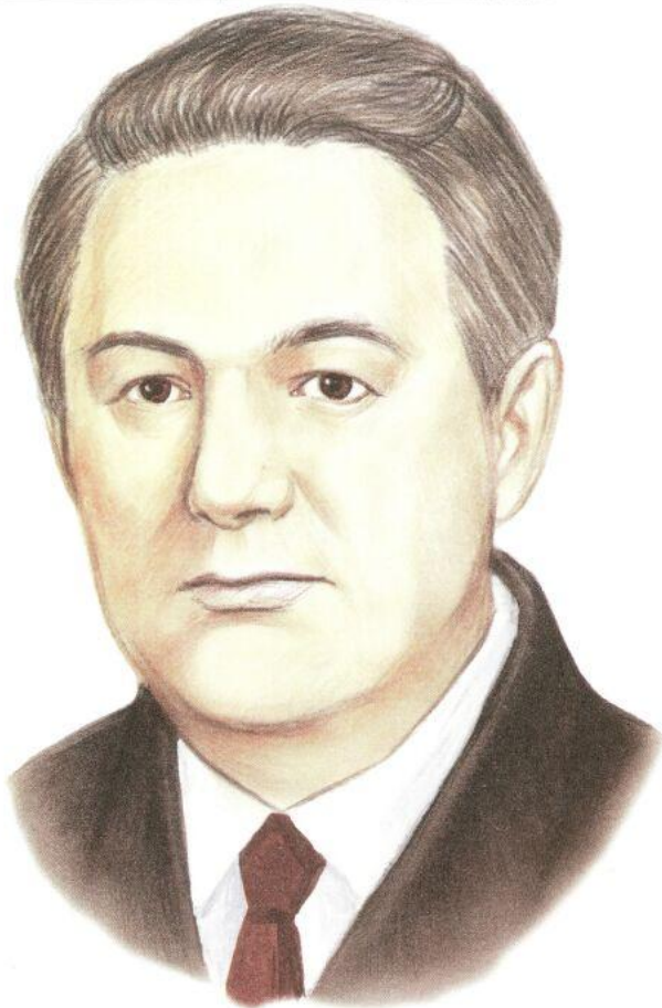
Сладков Николай Иванович (1920-1996)