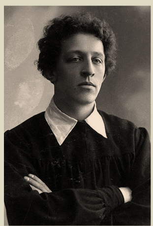
Александр Александрович Блок