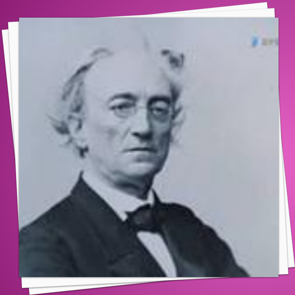
Фёдор Иванович Тютчев (1803 - 1873)