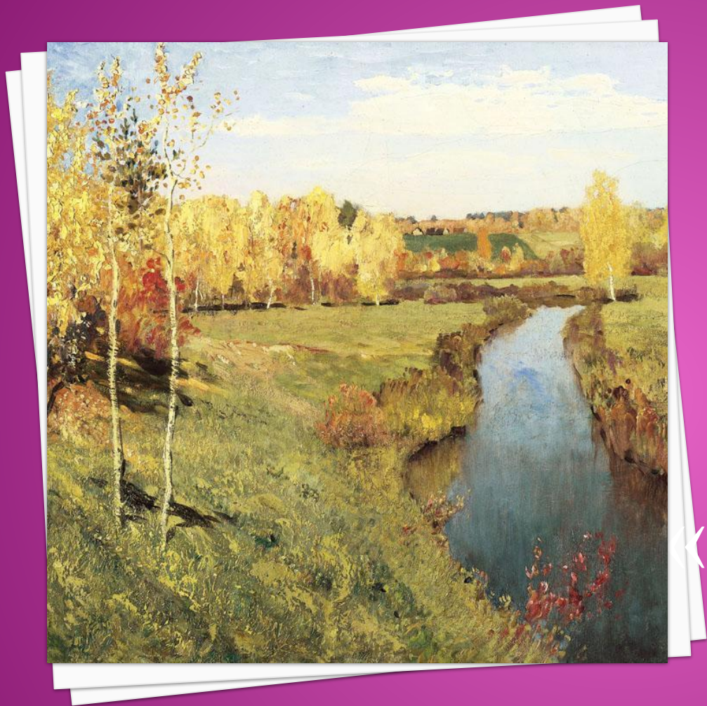
И.И. Левитан «Золотая осень» 1895 г.