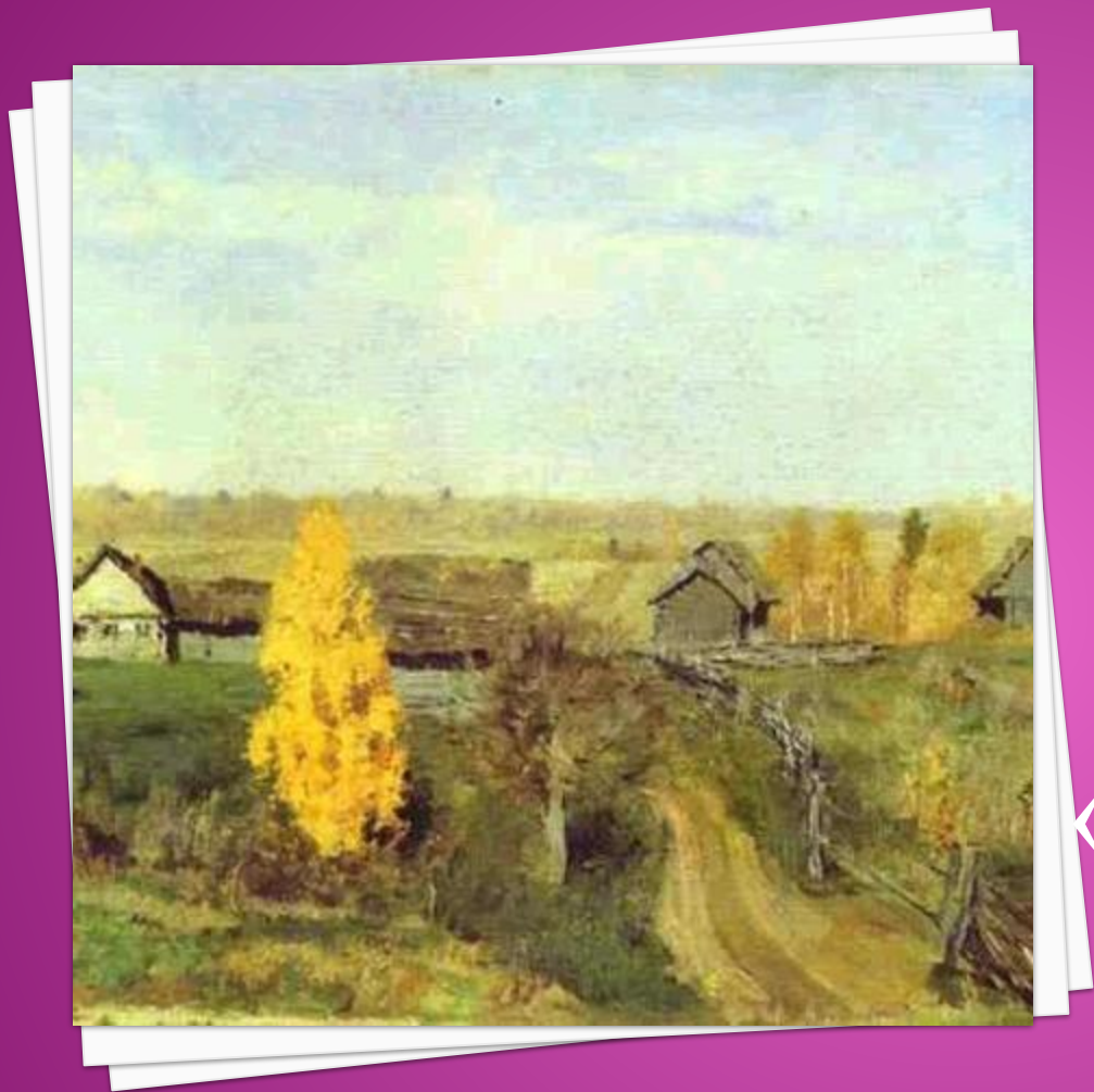
И.И. Левитан «Золотая осень. Слободка» 1889г.