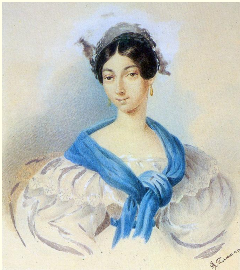
Надежда Осиповна Пушкина