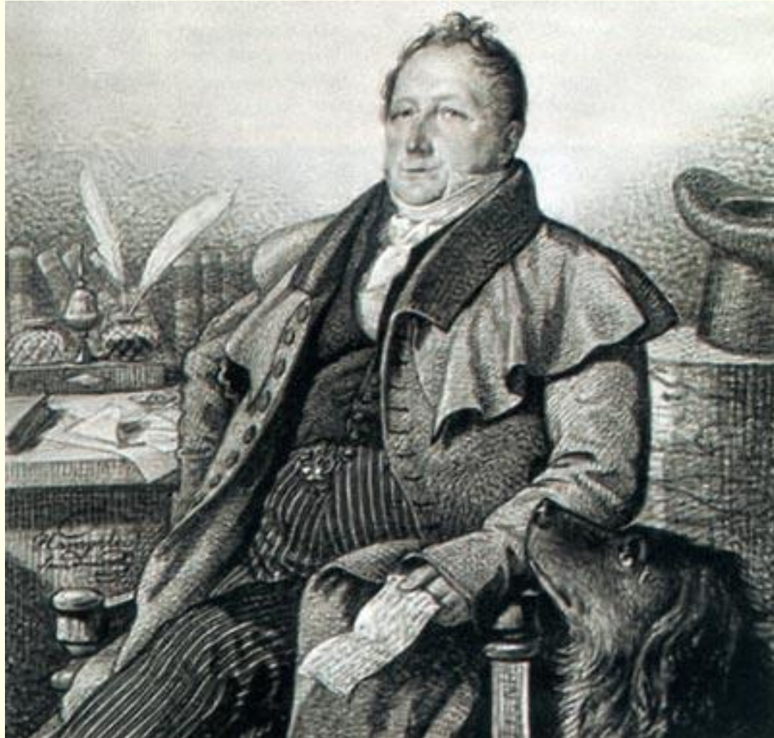
Сегрей Львович Пушкин