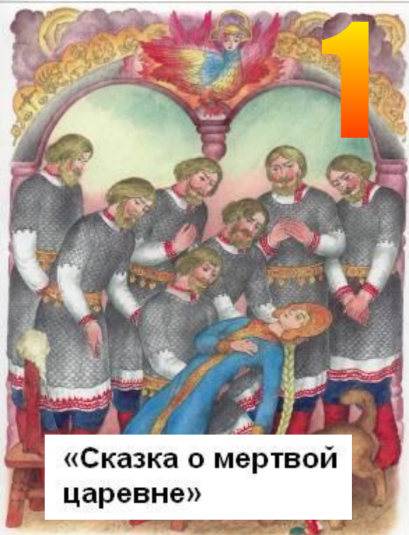
«Сказка о мертвой царевне»