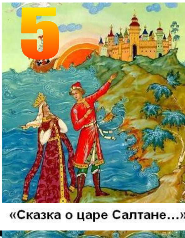
«Сказка о царе Салтане...»