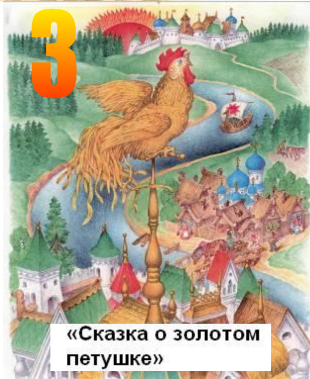
«Сказка о золотом петушке»