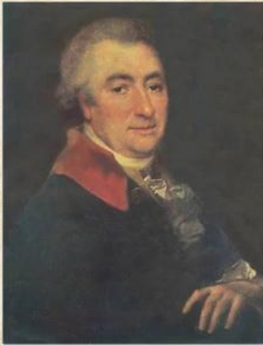
Николай Иванович Новиков (1744—1818)