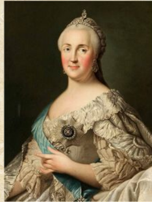
Императрица всероссийская Екатерина II с 1762 по 1796 годы.