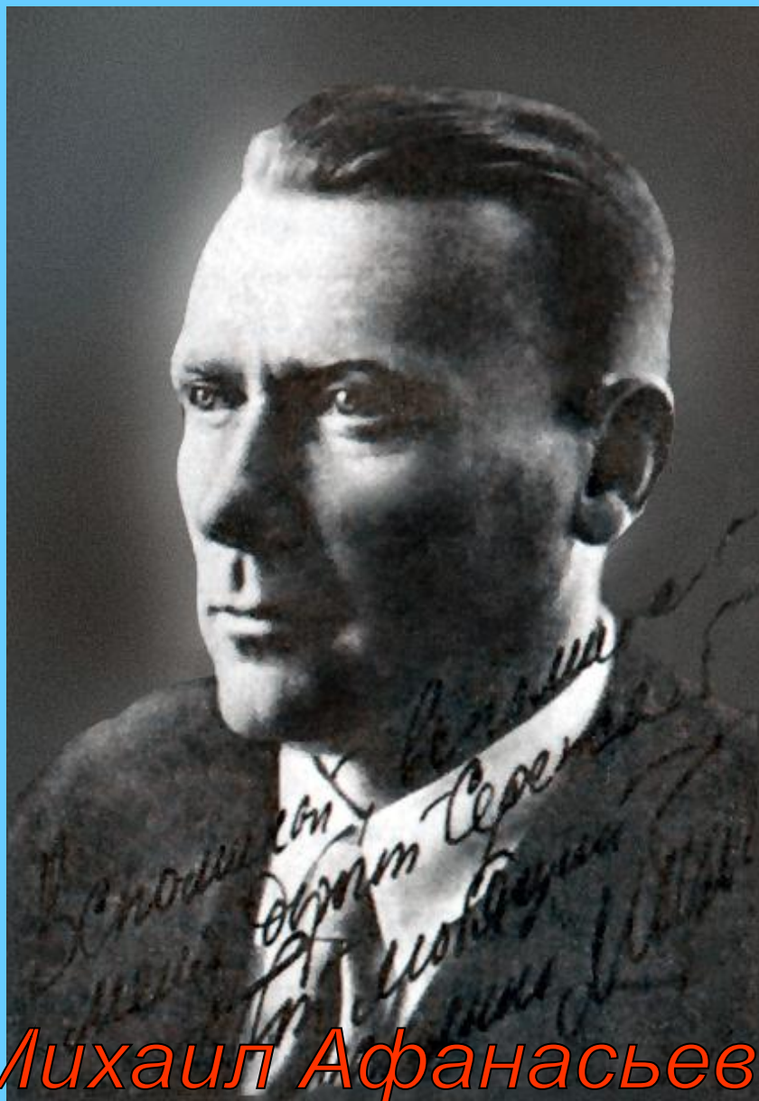
Михаил Афанасьевич Булгаков