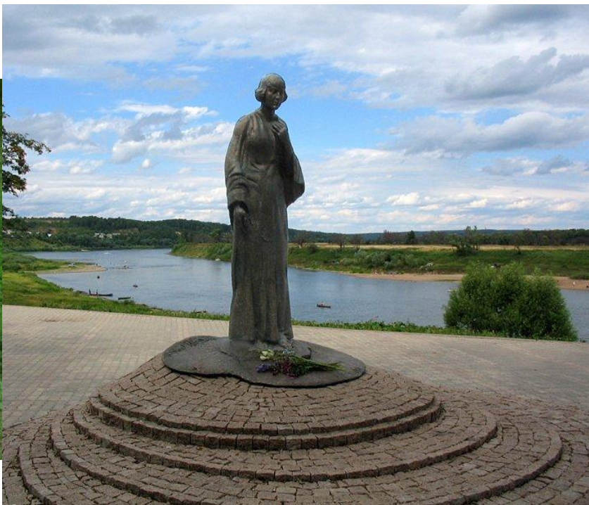
Памятник Марине Цветаевой в Тарусе