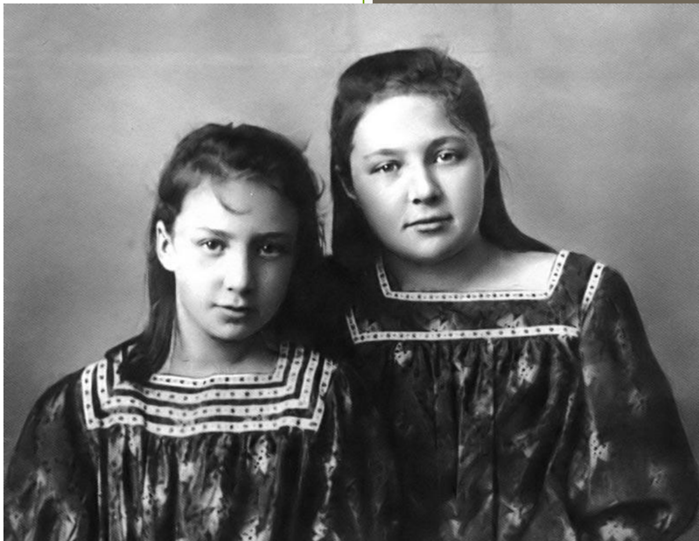
Марина и Анастасия Цветаевы