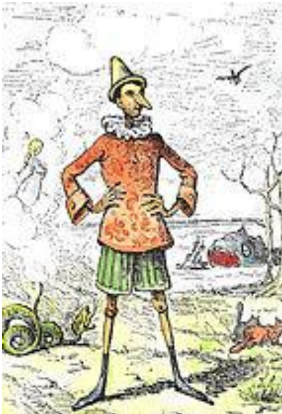
иллюстрация к повести