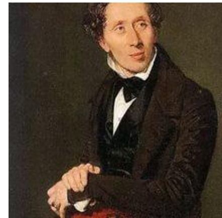
Г.Х. Андерсон 1805-1875