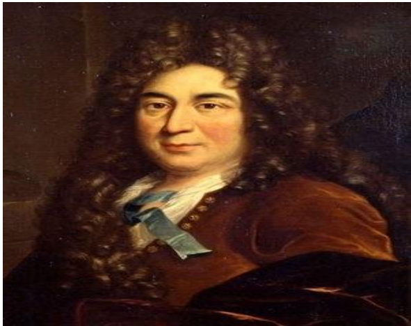
Ш. Перро 1628- 1703