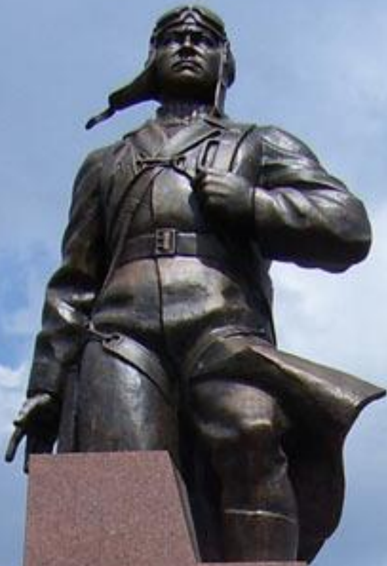
Памятник А. Маресьеву в городе Камышине