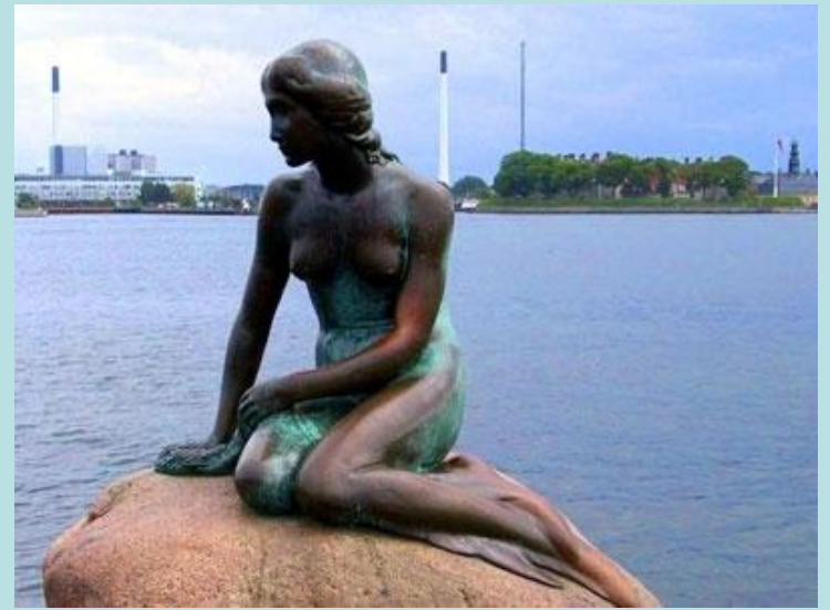
Русалочка в Дании