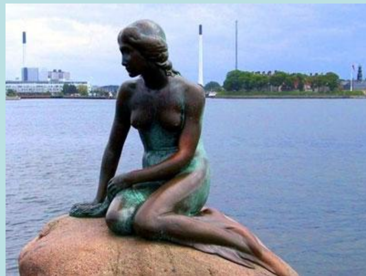
Русалочка в Дании