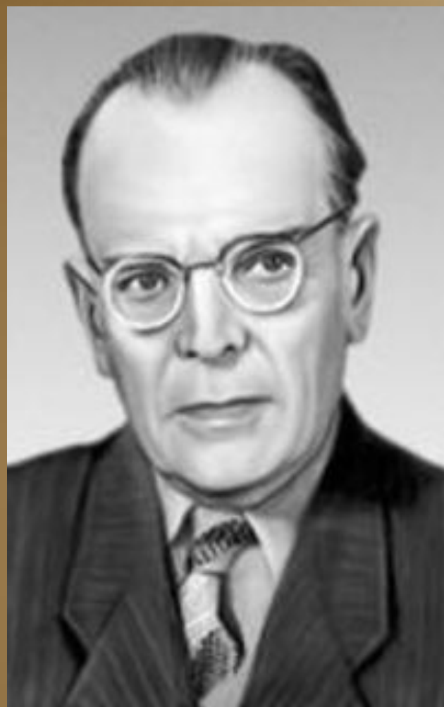
К. Г. Паустовский. «Сказки пушкина»