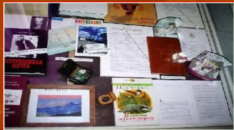
Полки музея К. Паустовского