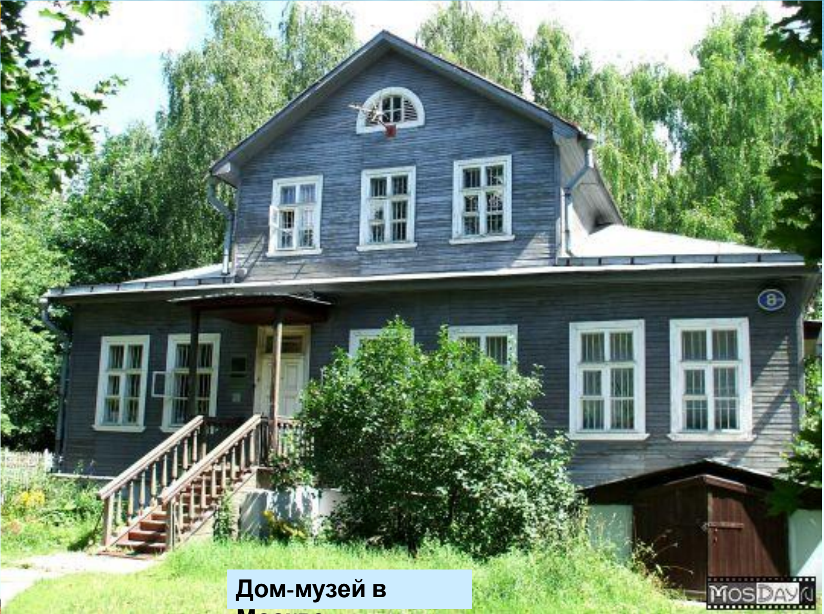
Дом-музей в Москве