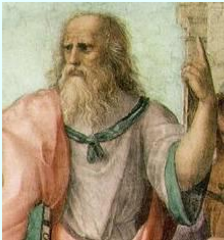
Древнегреческий ученый Платон

«Стараясь о счастье других, мы находим свое собственное счастье»