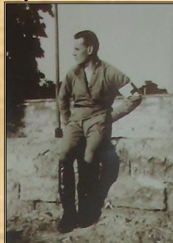
На фронте. 1915 год.

В 1915 году с полевым санитарным отрядом отступал вместе с русской армией по Польше и Белоруссии.