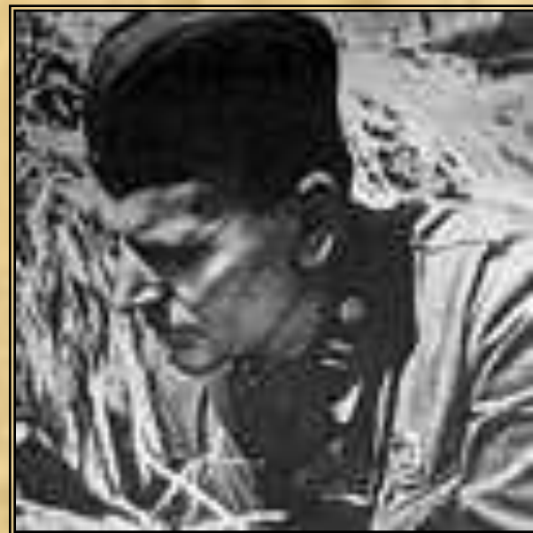
На фронте. 1941 год.

В годы Великой Отечественной войны Паустовский работал военным корреспондентом на Южном фронте и писал рассказы.