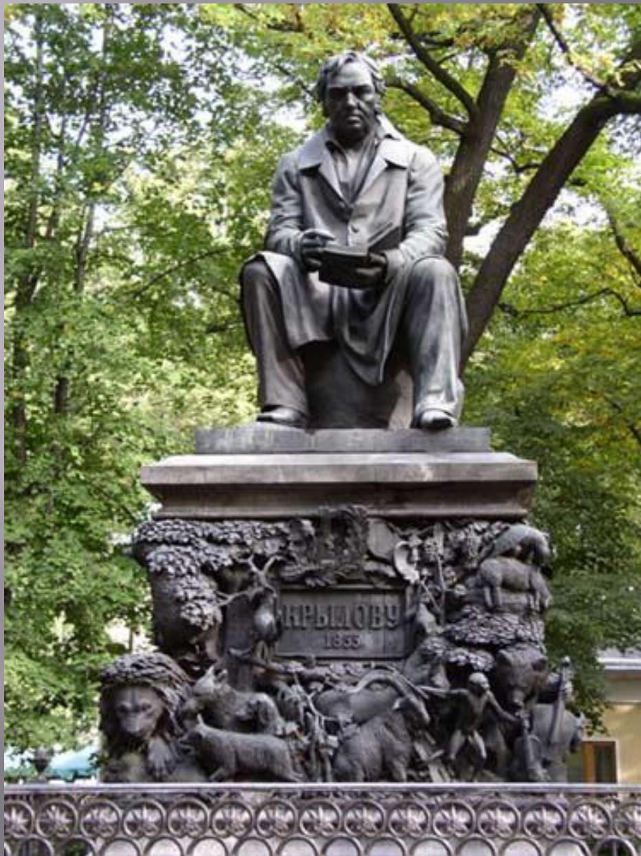
Памятник И. А.Крылову в Летнем саду