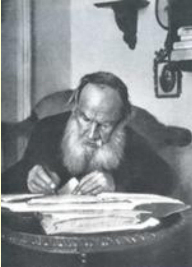
Л. Н. Толстой за работой (1909)