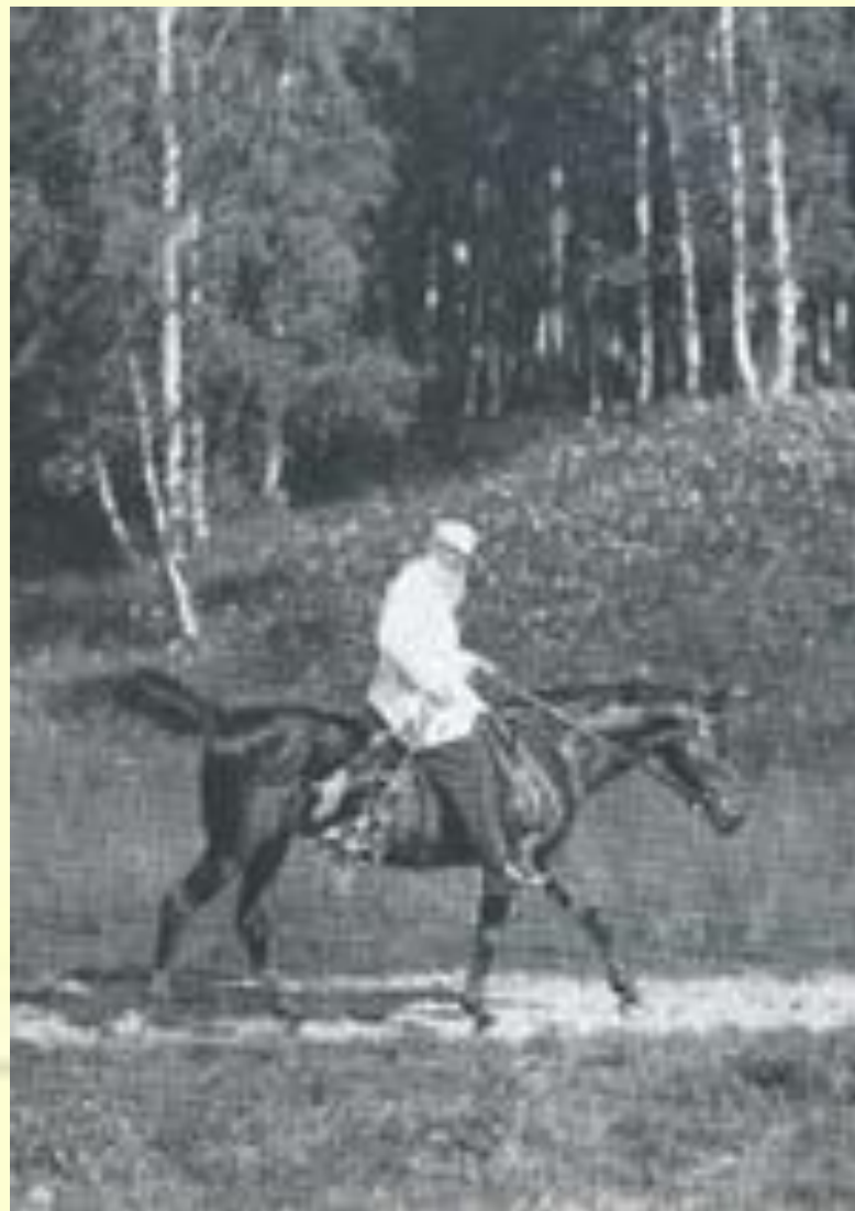
Л. Н. Толстой верхом на Делире (1908)