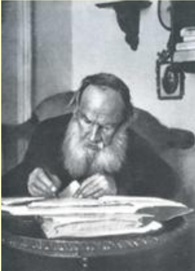
Л. Н. Толстой за работой (1909)