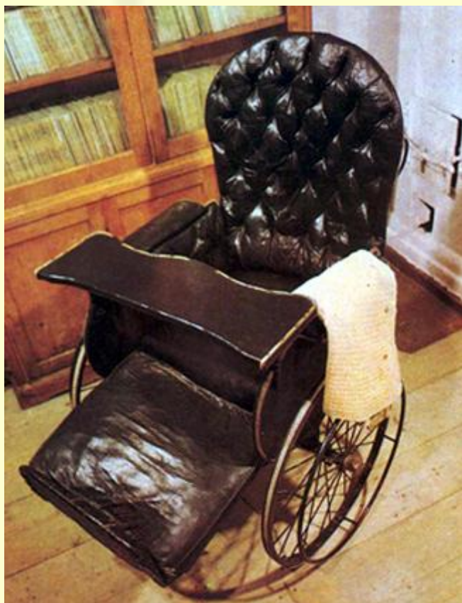
Кресло Л.Н. Толстого