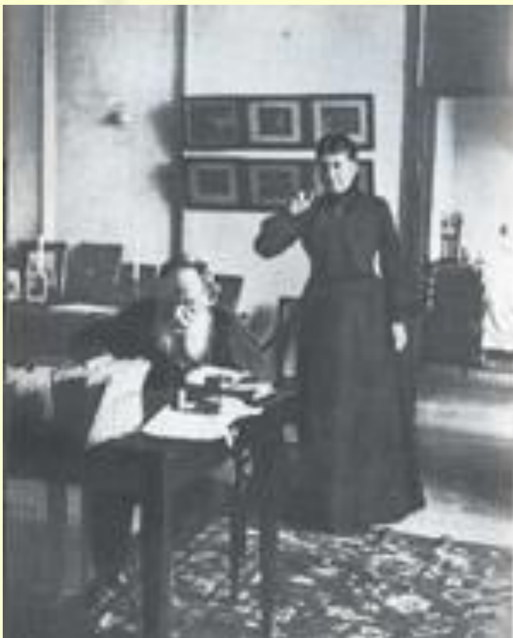
Л. Н. Толстой и С. А. Толстая в кабинете (1902)