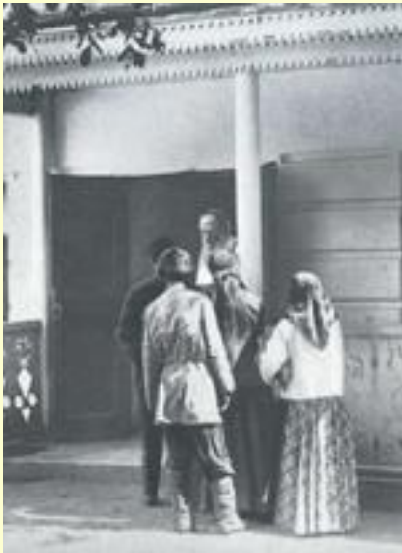
Л. Н. Толстой с крестьянами(1908)