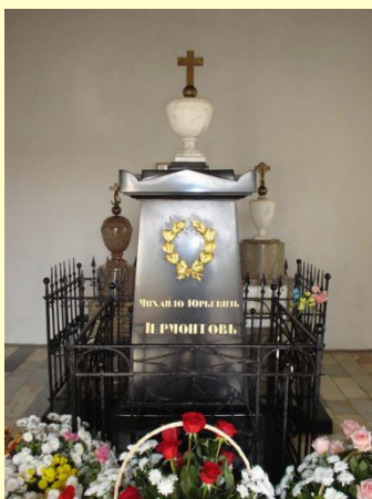
Могила М.Ю. Лермонтова