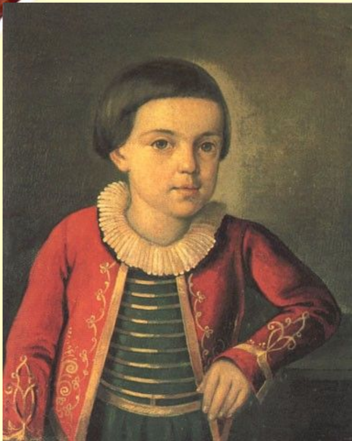
Самый ранний из известных портретов Лермонтова (1820-1822 год)