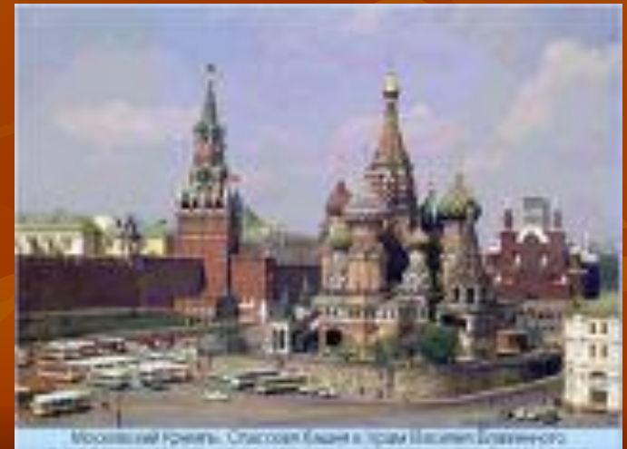
Московский Кремль. Спасовая башня и храм Анны Благовенной

«Я рожден, чтобы целый мир был зритель торжества или гибели моей», - заявил он однажды.