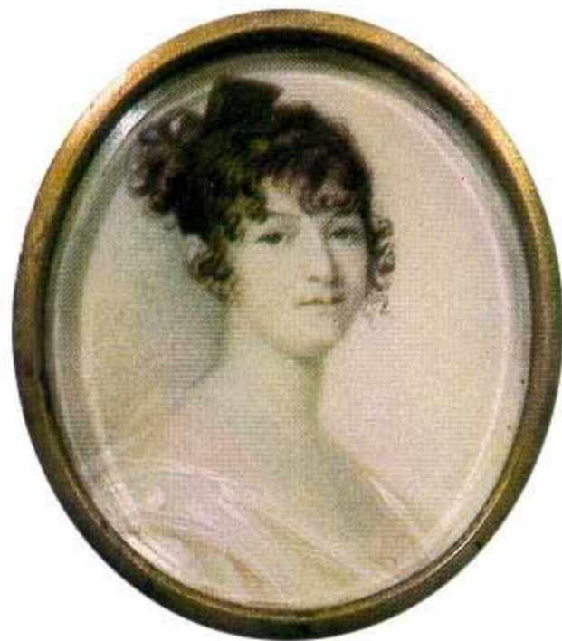
Н.О. Пушкина. 1800-е гг.

Мать, Надежда Осиповна, приходилась внучкой араму Петра I, впоследствии русскому генералу Ганнибалу.