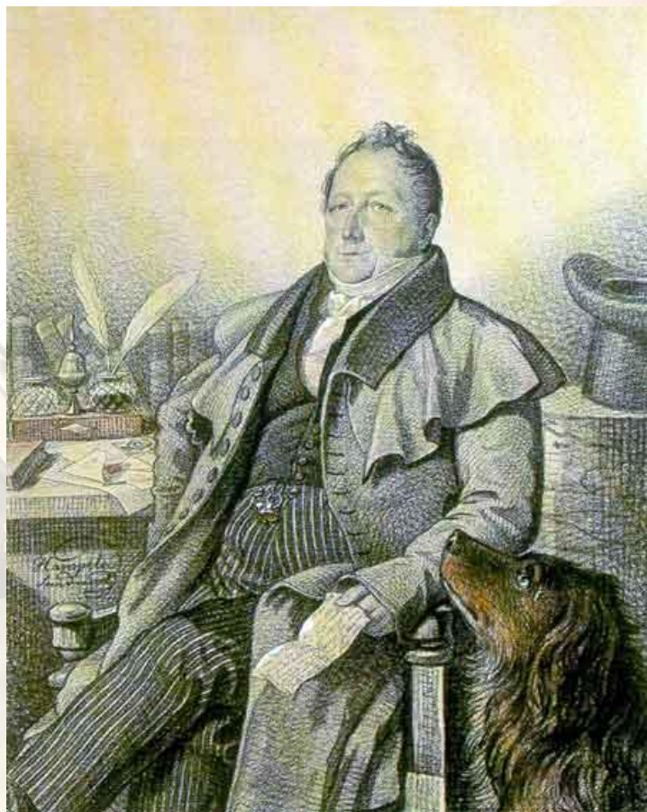
С.А. Пушкин. 1824.

Отец, Сергей Львович , небогатый помещик, человек образованный, хорошо знал литературу, был знаком со многими русскими писателями и сам немного писал.