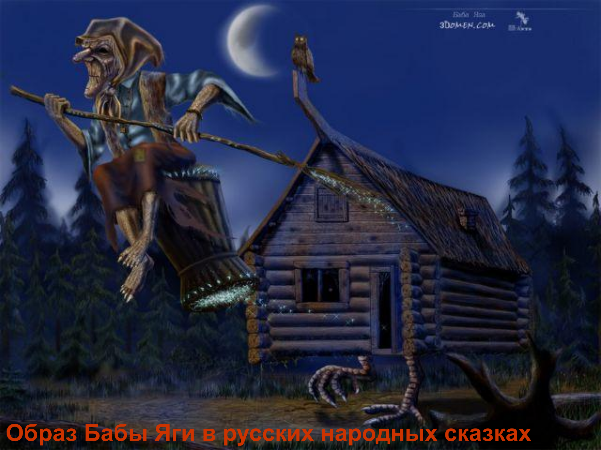
Образ Бабы Яги в русских народных сказках