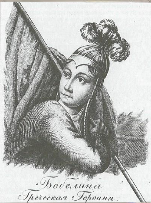
Бобелина Греческая Героиня.

«Потом следовала героиня греческая Бобелина, которой одна нога казалась больше всего туловища тех щеголей, которые наполняют нынешние гостиные».