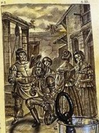
Y DICIE SORCELE BELLO UN BOM GIZEL