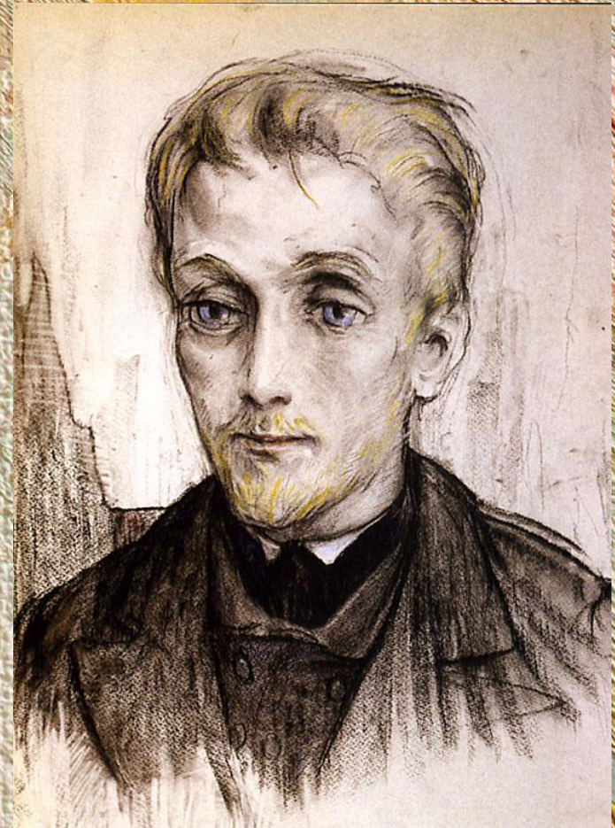
Князь Мышкин. И. Глазунов

На это полотно, которое висело в доме Рогожина, обратил внимание главный герой романа – Лев Мышкин: «...это в полном виде труп человека, вынесшего бесконечные муки еще до креста, раны, истязания, битье от стражи, битье от народа, когда он нес на себе крест и упал под крестом, и наконец крестную муку в продолжении шести часов». Осмотрев работу, князь воскликнул: «Да от этой картины у иного вера может пропасть!»»