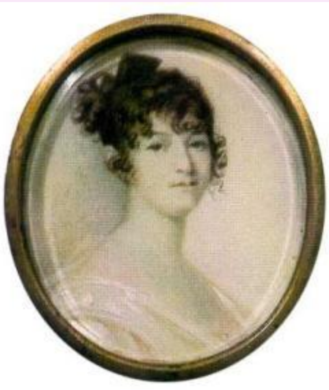
Мать, Надежда Осиповна, приходилась внучкой араму Петра I, впоследствии русскому генералу Ганнибалу.