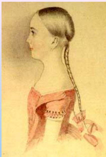
Старшая дочь, Мария Александровна Пушкина (1832-1919г.)