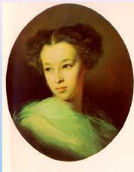
Младшая дочь, Наталья Александровна Пушкина (1836-1913г.)

У А.С.Пушкина и Натальи Гончаровой было четверо детей