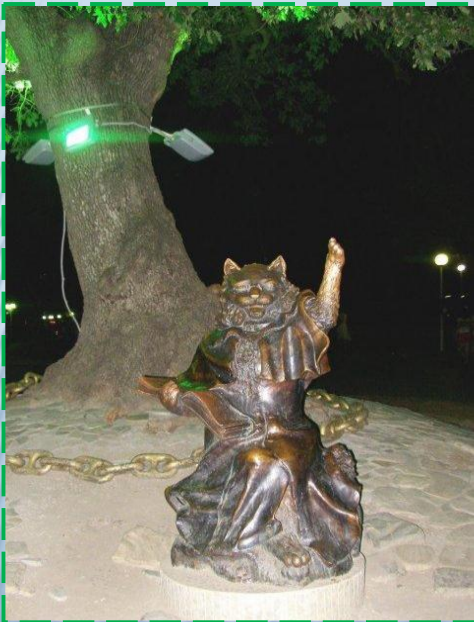
Кот учёный (Россия, Геленджик)