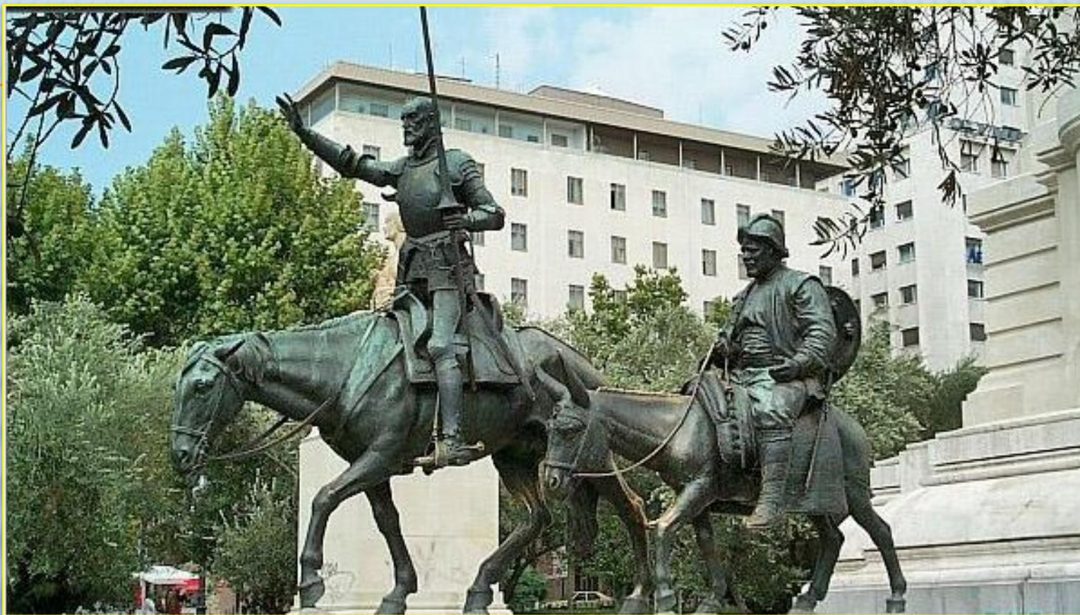
Памятник Дон Кихоту и Санчо Панса – героям М. Сервантеса «Дон Кихот». Испания, г.Мадрид.