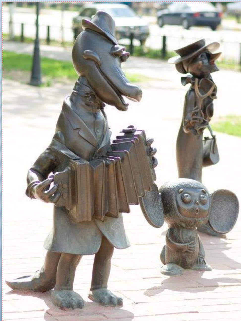
Крокодил Гена и его друзья (Московская область, Раменское)