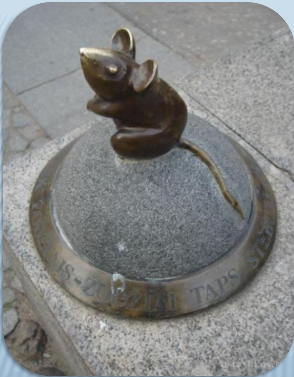
Мышка- норушка (Клайпеда, Литва)