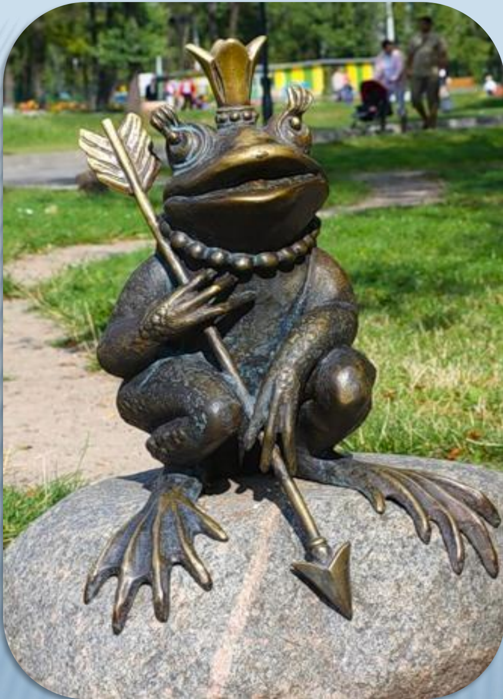
Царевна- лягушка Россия, Калининград