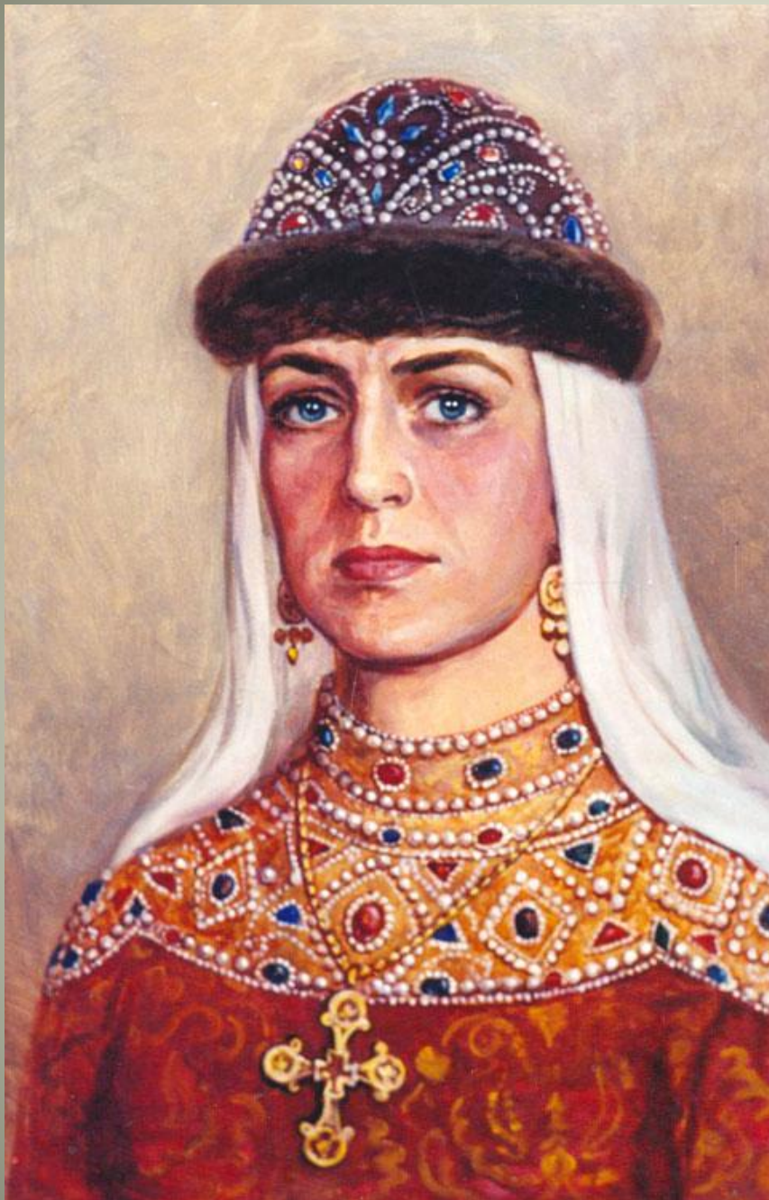
Княгиня Ольга, жена князя Игоря