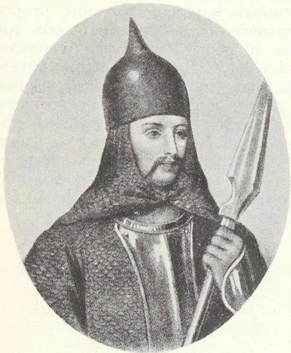
Князь Киевский Олег Вещий