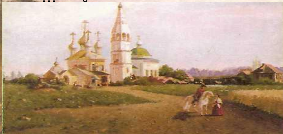
Окрестности села Константиново