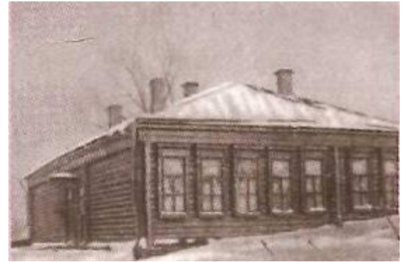
Константиновское земское училище

С.А. Есенин родился в Рязанской губернии в крестьянской семье. С 1904 по 1912 год учился в Константиновско м земском училище и в Спас- Клепиковской