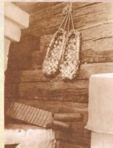
Интерьер дома- музея