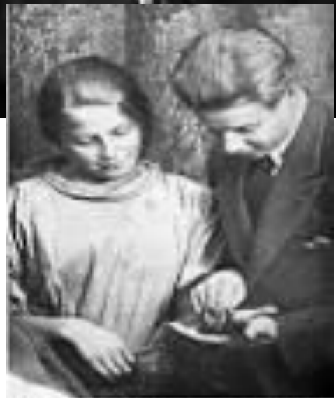
С. Есенин с сестрой Шурой. 1925 г.