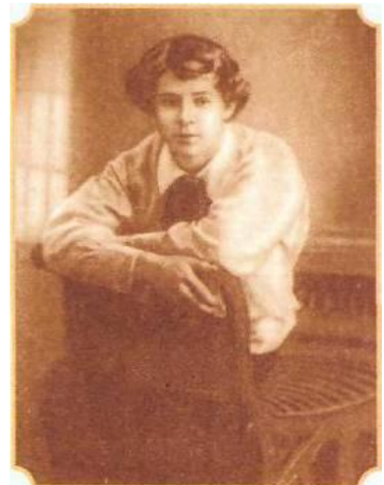
С.Есенин 1913—14 год