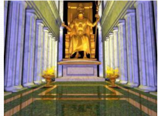
Статуя Зевса в Олимпии