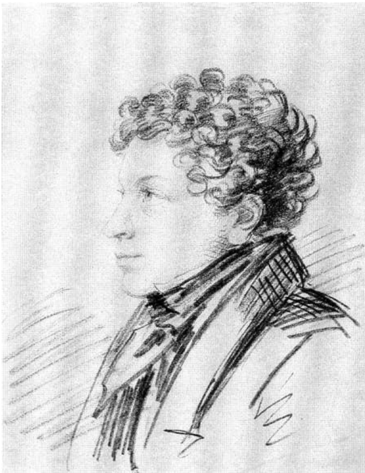
Лев, брат поэта